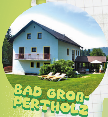
BAD GROS- PERTHOLZ

Es gelten die Allgemeinen Geschäftsbedingungen und Stornobedingungen des NÖ Jugendherbergswerks!